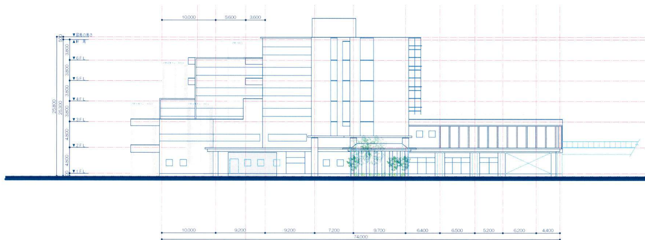
西立面図（病院・特定施設棟） S=1/400